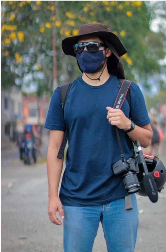
Ilustración 1 Realizador en la calle con sus equipos.

Desde el primer día de grabación oficial, el 28 de abril de 2021, se planearon las secuencias de filmación, incluyendo la participación activa del documentalista como camarógrafo principal. Esta elección influyó en la perspectiva y el estilo visual del documental. En la postproducción, se revisó y seleccionó cuidadosamente el material grabado, descartando tomas que no cumplían con los estándares de calidad, principalmente del audio.