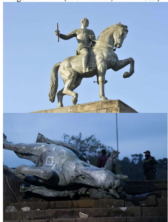
Ilustración 2 Estatua de Sebastián de Belalcázar ante y después de su