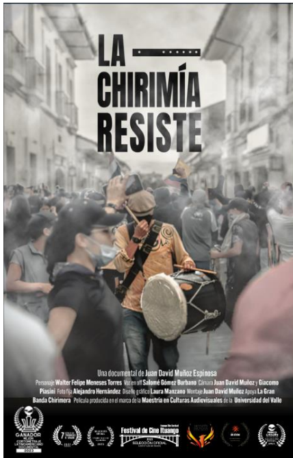
Ilustración 5 Poster del documental La chirimía resiste