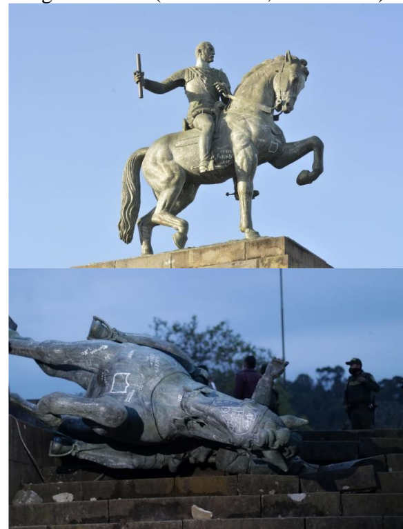
Ilustración 2 Estatua de Sebastián de Belalcázar ante y después de su