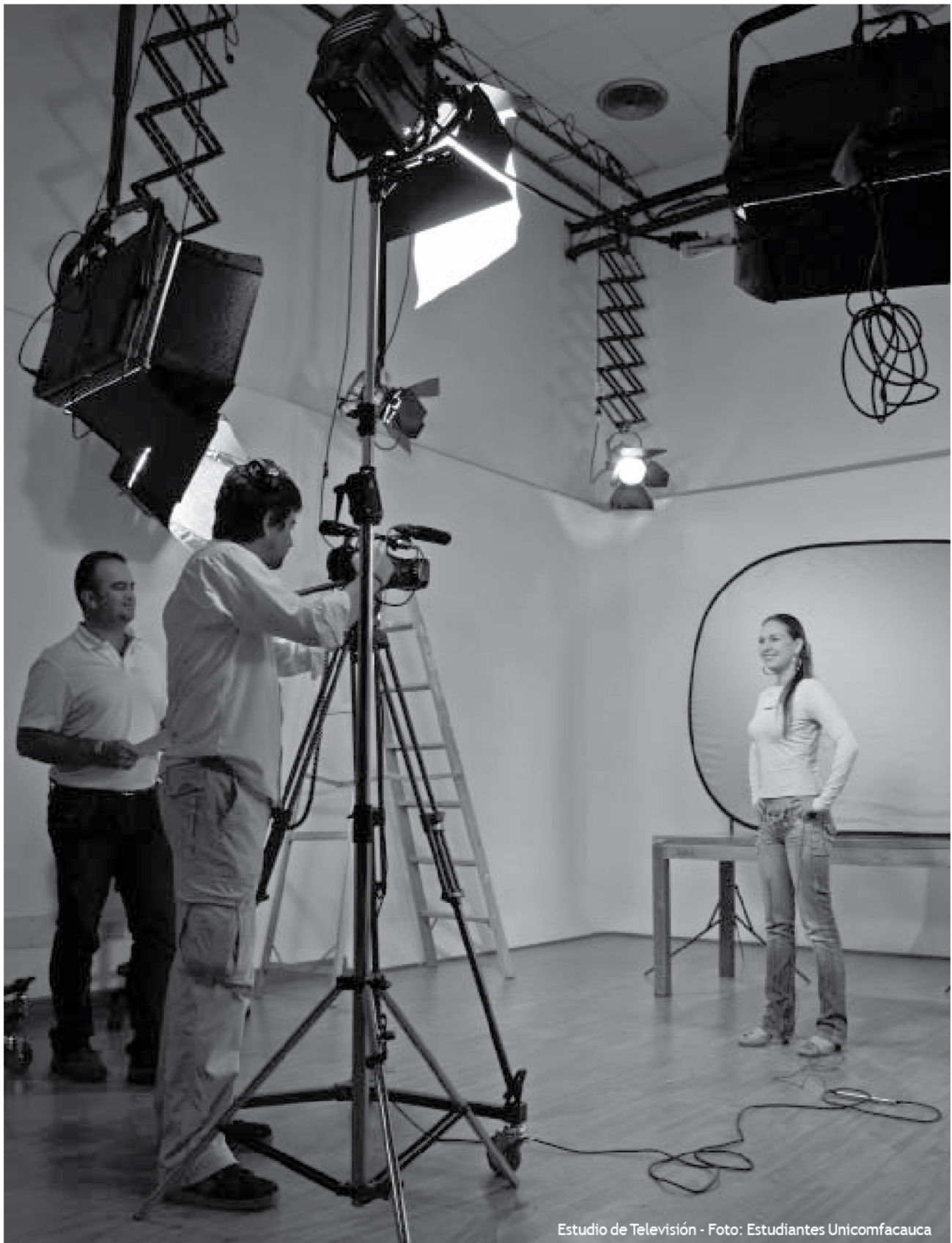
Estudio de Televisión