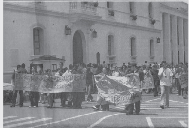
Otra protesta estudiantil en Unicauca