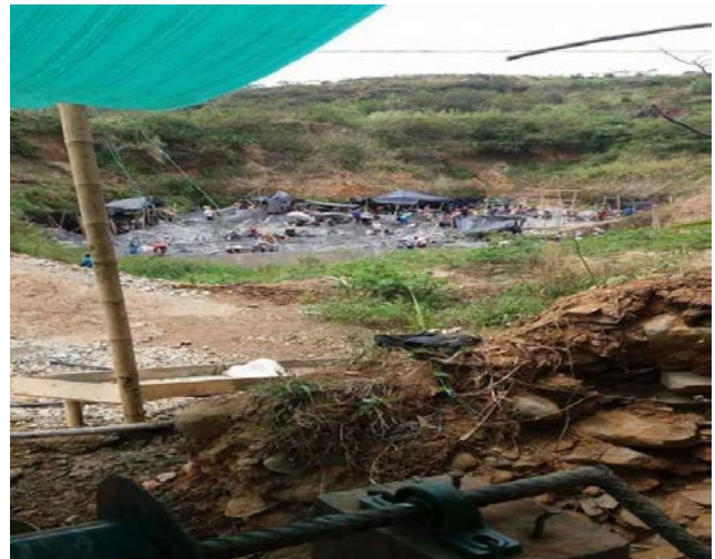
Gráfico 3 Explotación minera.