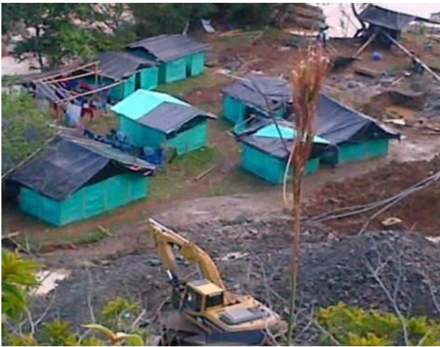
Gráfico 2 Explotación minera.