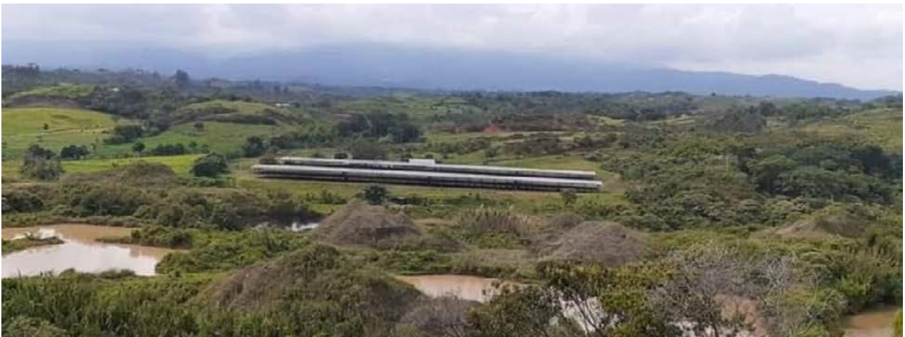
Gráfico 4 Explotación minera.