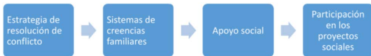
Gráfico 1 Ruta resiliente.

Al mismo tiempo, el diseño de investigación empleado fue el estudio de caso, el cual permitió estudiar a las familias participantes desde las características comunes como lo es ser beneficiarias de los proyectos sociales de la Arquidiócesis de Tunja (Boyacá) y compartir experiencias similares, estas experiencias fueron relatadas por las voces vivas de cada familia, el muestreo utilizado fue casos tipo Según (Sampieri, Fernandez & Baptista, 2014, p.397) “el objetivo de este muestreo es la riqueza, profundidad y calidad de la información, no la cantidad ni la estandarización”, este comprende el abordaje de 5 familias que dieron a conocer cuáles fueron los factores protectores que utilizaron como